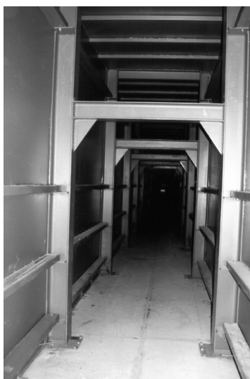
Hauptluftkanal bis 5,0 m hoch siehe Seite 54 Trapezwände