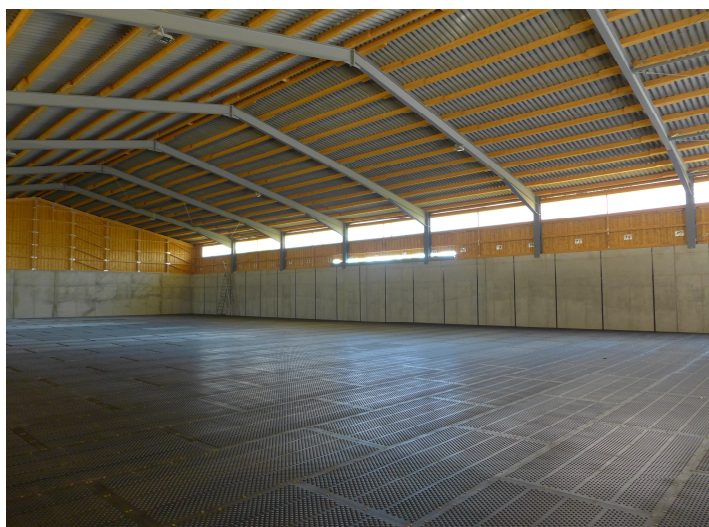
Getreideflachlager mit Belüftungstrocknung